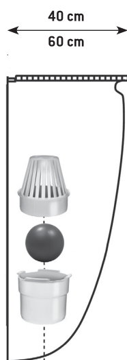
Montaż blokady zapachów MEASTOP W doświetlaczach o głębokości (odstęp od muru) 40 lub 60 cm